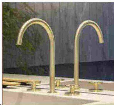
● Valvola 02 , tutto il fascino dei rubinetti industriali. https://quadrodesign.it