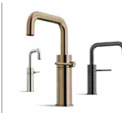
● Velis , dalle linee moderne e senza tempo. www.nobili.it