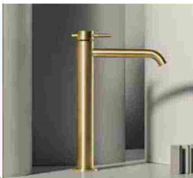
● Helm , forme geometriche pure arricchite da colori e texture. www.zucchettikos.it