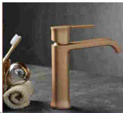
● Finishes Selection , collezione in diverse cromie disponibili. www.ritmonio.it