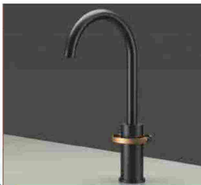
● Charm , con anello concentrico al corpo. www.rubinetteriestella.it