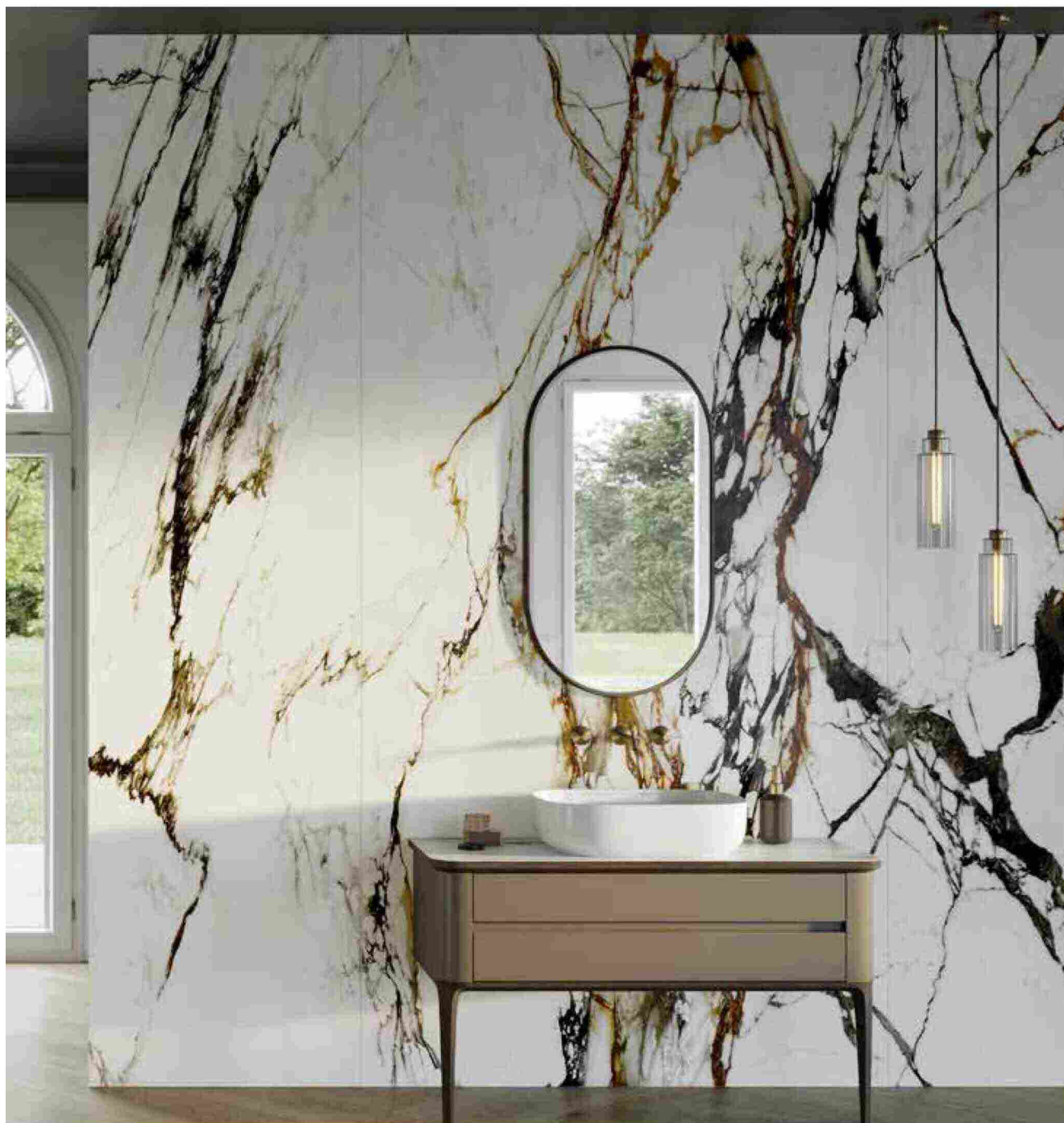
100 IDEE per Ristrutturare - 41

LA STANZA DA BAGNO ACCOGLIE MATERIALI PREZIOSI ED ELEGANTI, COME IL MARMO, IL QUARZO, L'ORO E L'OTTONE, PER DONARE ALL'AMBIENTE DIGNITÀ E RICERCATEZZA