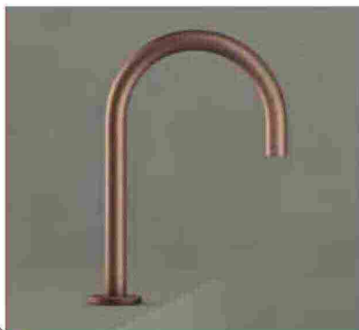
● Swan , a infrarossi in ottone cromato. www.thewatermarkcollection.com

ORO, OTTONE E RAME SONO METALLI CHE, CON I LORO COLORI CALDI, SI ABBINANO PERFETTAMENTE A PIETRE RICERCATE COME IL MARMO E IL QUARZO