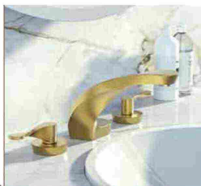
● Ametis , rubinetto dalle forme futuristiche color oro. www.graff-designs.com