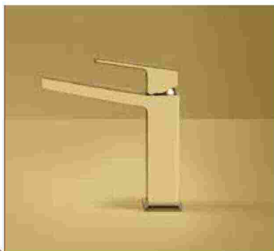
● Kelio 63 , con finitura dorata opaca. www.fir-italia.it