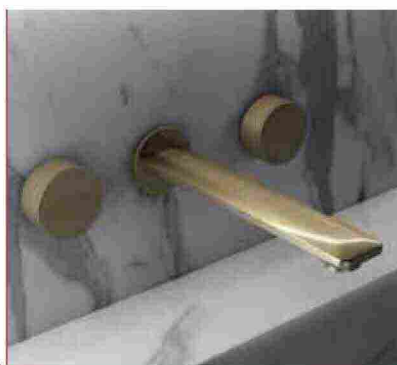
● Laguna , design classico ma dalle forme leggere. https://laguna.jaquer.com